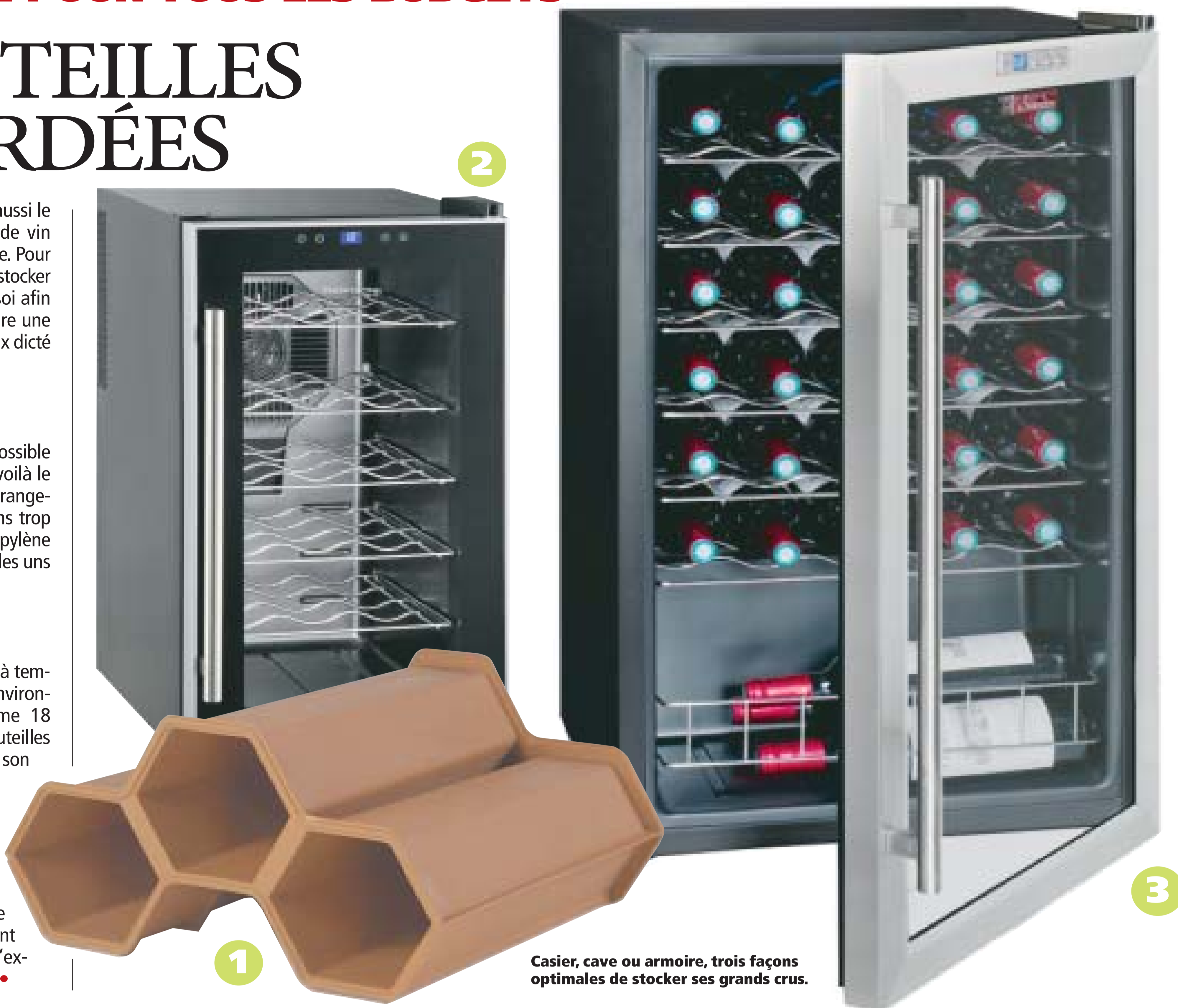
Casier, cave ou armoire, trois façons optimales de stocker ses grands crus.

Les puristes peuvent choisir la cave de service La Sommelière (359 €). Son système antivibrations protège les vins de l'oxydation due aux secousses et participe au bon déroulement du processus de vieillissement. Un matériel d'exception pour ne pas abîmer ses grands crus.